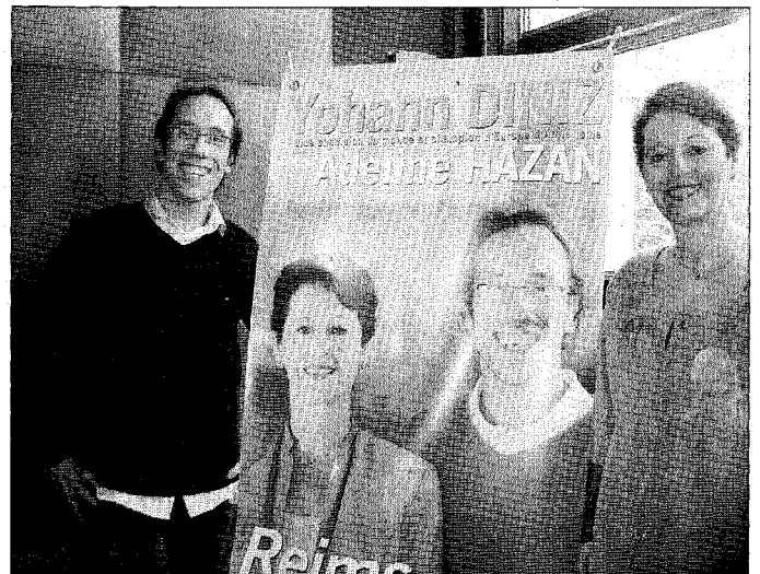
S'il ne sera pas sur la liste de la candidate socialiste, l'athlète rémois licencié de l'EFSRA, n'exclut pas un engagement plus important une fois sa carrière sportive terminée.

Un immense comité de soutien ouvert à tous les Rémois sachant que la candidate compte sans doute en attirer un peu plus derrière elle en mars prochain.